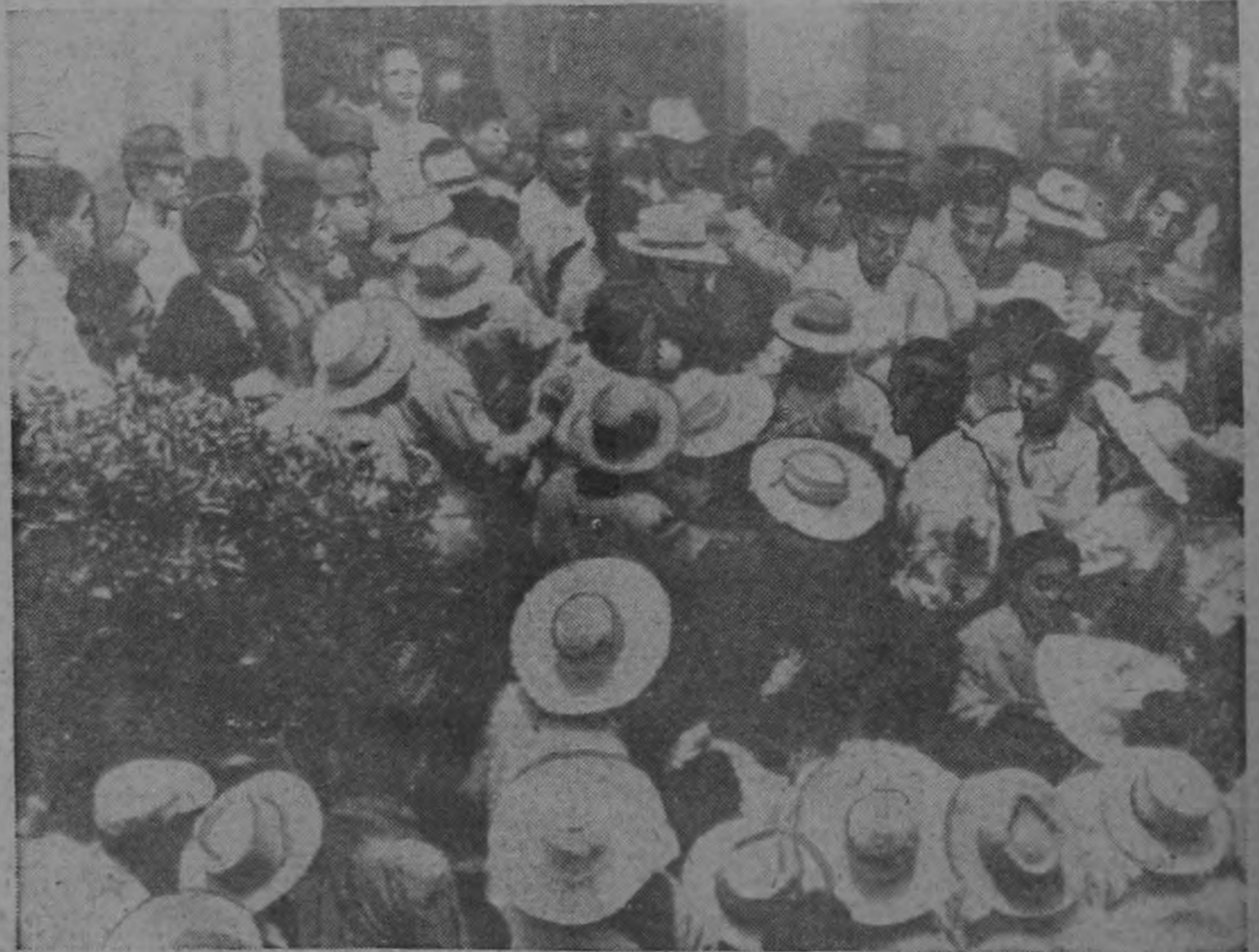
Miembros de la Asamblea Nacional de Corea del Sur tratan de abrirse paso por entre unos 500 partidarios del Presidente Syngman Rhee que los tuvieron sitiados durante cinco horas en el edificio de la legislatura de Pusón. Este suceso es parte de una serie relacionada con la campaña de Rhee en busca de su reelección.